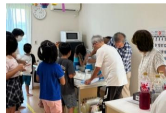
「今日のオヤツはかき氷！」