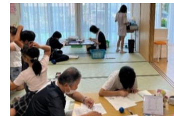
「何して遊ぼうかな〜♪」