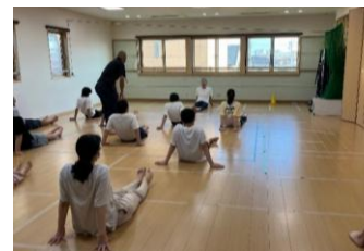
体操教室--「足を伸ばして〜」