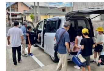
帰りの送り--「今日も楽しかったね」